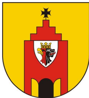
Herb gminy Radziejów