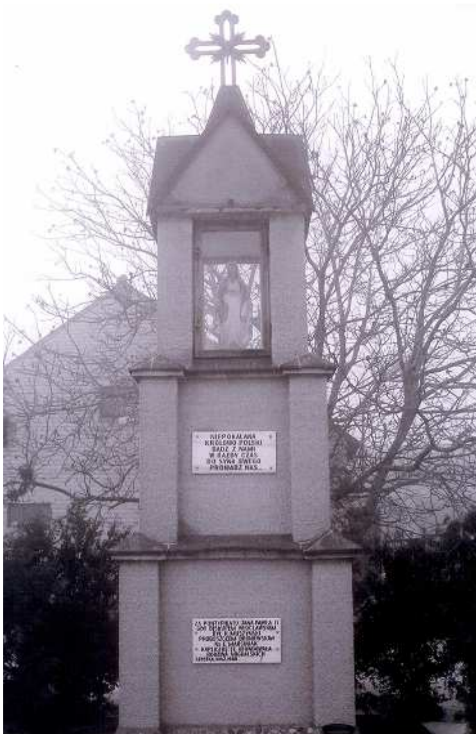
Przydrożna kapliczka w Szostce