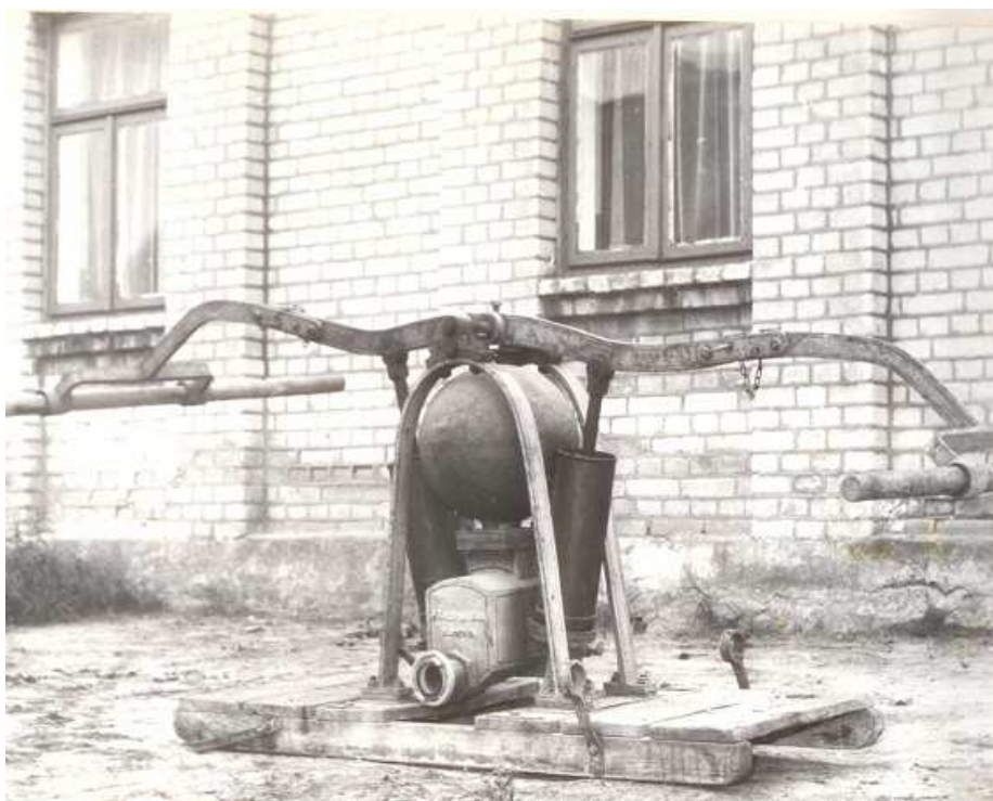
Sikawka ręczna z lat trzydziestych, którą gaszono pożary w Szostce i okolicy