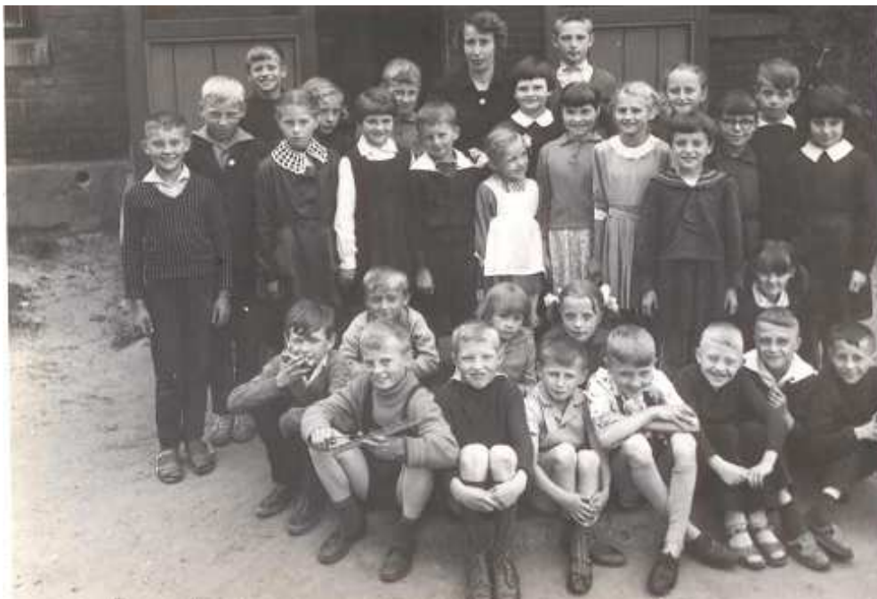
Dzieci uczęszczające do szkoły w roku 1965/66 wraz z wychowawczynią