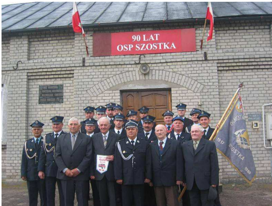
90- lecie Ochotniczej Straży Pożarnej w Szostce - 6 maja 2007 roku