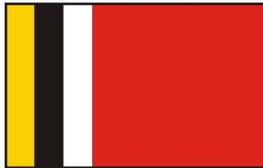
Flaga gminy Radziejów