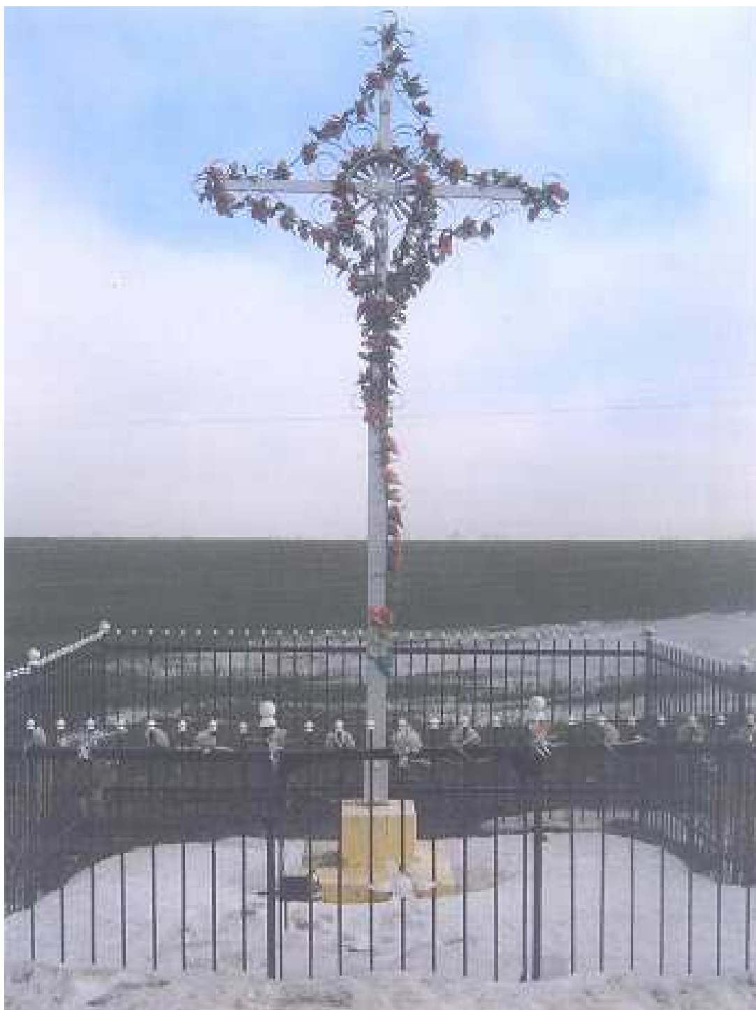
Krzyż w Szostce