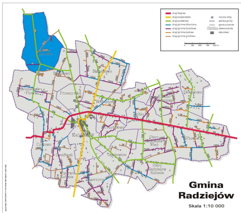
Mapa Gminy Radziejów z zaznaczonym położeniem Szostki

Szostka leży w województwie kujawsko - pomorskim, w powiecie radziejewskim, na terenie gminy Radziejów. Jest oddalona o około 6 km na północny zachód od Radziejowa. W latach 1975 - 1998 wieś administracyjnie należała do województwa włocławskiego. Miejscowość zajmuje powierzchnię 7,43 km 2 , zamieszkuje ją aktualnie 200 osób.